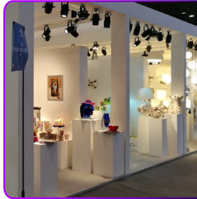
IMMAGINE STAND PURAMENTE INDICATIVA

➔ Stand pre-allestito in area Prime Location: € 4.600 + IVA